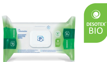
DESCOCEPT SENSITIVE WIPES