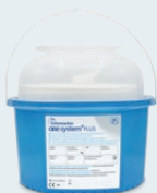
ONE SYSTEM+ PLUS